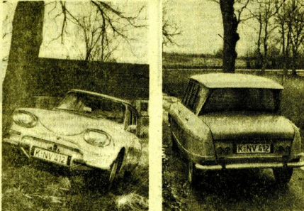
Auf grundlosen Störwegen bewies der „Ami 4“ seine tadellose Strafenlage. Unten rechts ist die schräge Heckschleife zu erkennen...